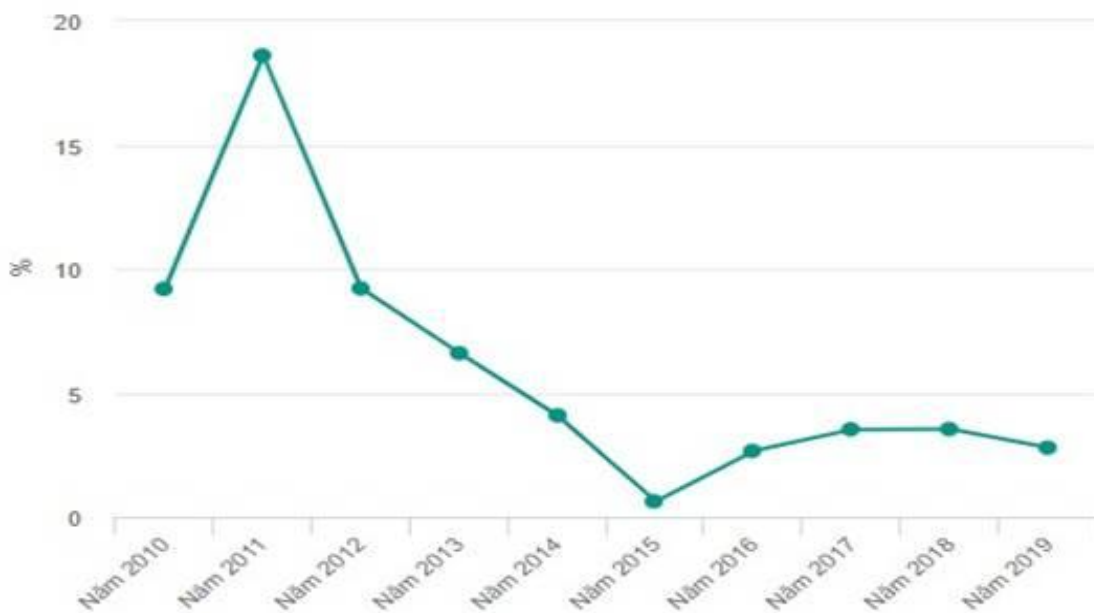
Lạm phát Việt Nam, giai đoạn 2010-2019

Trong bối cảnh nền kinh tế tăng trưởng mạnh mẽ, lạm phát năm 2019 chỉ đạt 2,73%. Như vậy lạm phát năm 2019 thấp nhất trong 3 năm gần đây khi năm 2018 là 3,54% và năm 2017 là 3,53%. Lạm phát duy trì ở mức thấp tiếp tục tạo cơ hội cho Ngân hàng Nhà nước thực hiện các chính sách nới lỏng tiền tệ linh hoạt và hiệu quả hơn.