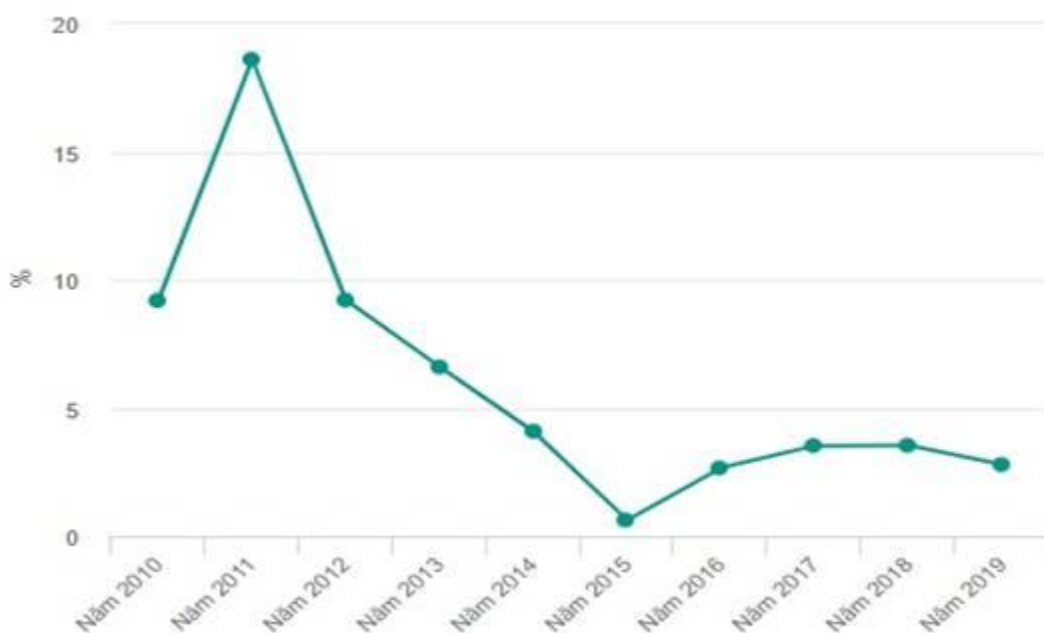
Lạm phát Việt Nam, giai đoạn 2010-2019

Trong bối cảnh nền kinh tế tăng trưởng mạnh mẽ, lạm phát năm 2019 chỉ đạt 2,73%. Như vậy lạm phát năm 2019 thấp nhất trong 3 năm gần đây khi năm 2018 là 3,54% và năm 2017 là 3,53%. Lạm phát duy trì ở mức thấp tiếp tục tạo cơ hội cho Ngân hàng Nhà nước thực hiện các chính sách nới lỏng tiền tệ linh hoạt và hiệu quả hơn.