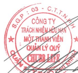
Lâm Hải Tuấn Chủ tịch Công ty Ngày 26 tháng 3 năm 2019

Các thuyết minh từ trang 16 đến trang 26 là một phần cấu thành của báo cáo này.