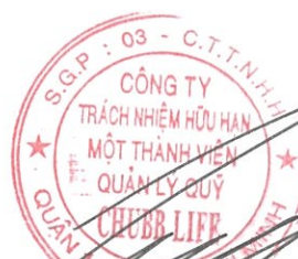
Lâm Hải Tuấn Chủ tịch Công ty Ngày 11 tháng 8 năm 2017

Các thuyết minh từ trang 10 đến trang 25 là một phần cấu thành báo cáo tài chính giữa niên độ này.