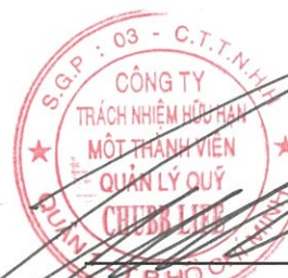
Lâm Hải Tuấn Chủ tịch Công ty Ngày 11 tháng 8 năm 2017

Các thuyết minh từ trang 10 đến trang 25 là một phần cấu thành báo cáo tài chính giữa niên độ này.