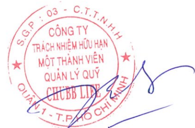
Bùi Thanh Hiệp Phó Chủ tịch Công ty Ngày 13 tháng 8 năm 2019

Các thuyết minh từ trang 11 đến trang 27 là một phần cấu thành báo cáo tài chính giữa niên độ này.