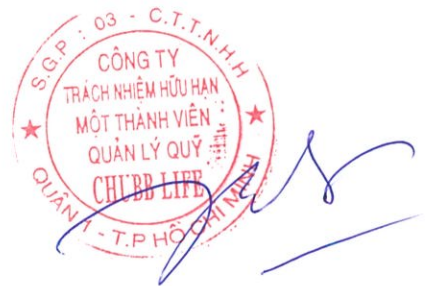
Bùi Thanh Hiệp Phó Chủ tịch Công ty Ngày 13 tháng 8 năm 2019

Các thuyết minh từ trang 11 đến trang 27 là một phần cấu thành báo cáo tài chính giữa niên độ này.