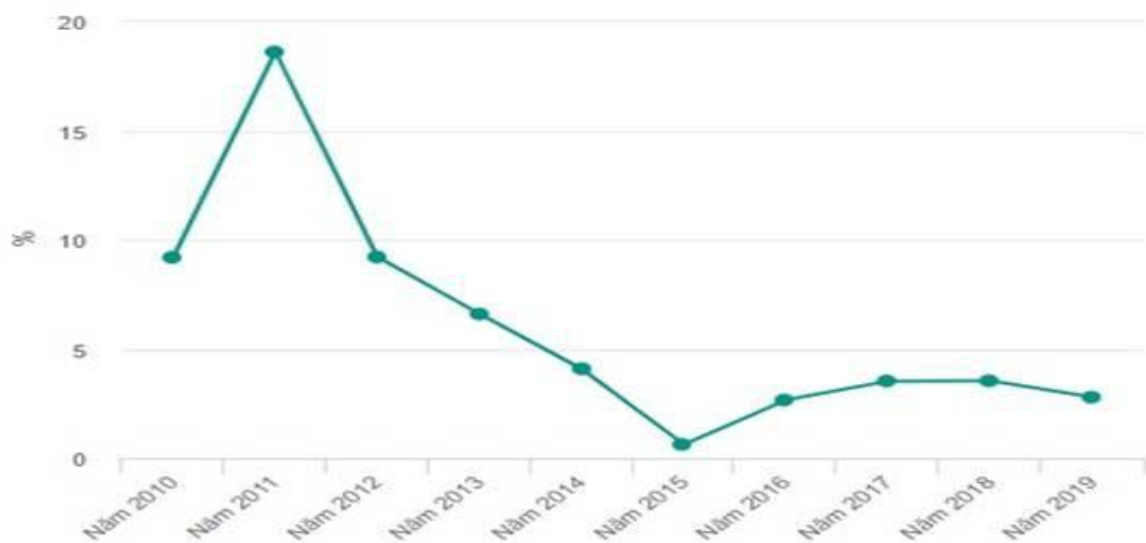
Lạm phát Việt Nam, giai đoạn 2010-2019

Trong bối cảnh nền kinh tế tăng trưởng mạnh mẽ, lạm phát năm 2019 chỉ đạt 2,73%. Như vậy lạm phát năm 2019 thấp nhất trong 3 năm gần đây khi năm 2018 là 3,54% và năm 2017 là 3,53%. Lạm phát duy trì ở mức thấp tiếp tục tạo cơ hội cho Ngân hàng Nhà nước thực hiện các chính sách nới lỏng tiền tệ linh hoạt và hiệu quả hơn.