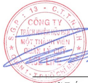
Lâm Hải Tuấn Chủ tịch Công ty