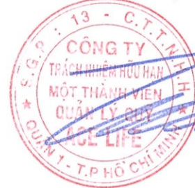
Lâm Hải Tuấn