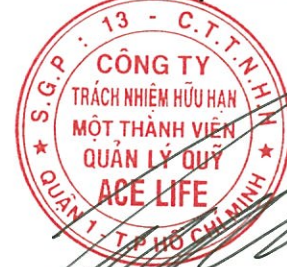
Lâm Hải Tuấn