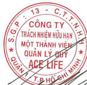
Lâm Hải Tuấn Chủ tịch Công ty