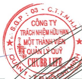
Lâm Hải Tuấn Chủ tịch Công ty