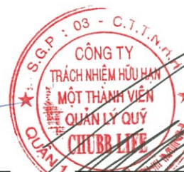
Lâm Hải Tuấn Chủ tịch Công ty Ngày 27 tháng 3 năm 2017

Các thuyết minh từ trang 10 đến trang 24 là một phần cấu thành các báo cáo tài chính này.