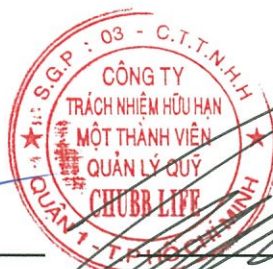
Lâm Hải Tuấn Chủ tịch Công ty Ngày 27 tháng 3 năm 2017

Các thuyết minh từ trang 10 đến trang 24 là một phần cấu thành các báo cáo tài chính này.