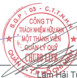
Lâm Hải Tuấn Chủ tịch Công ty Ngày 26 tháng 3 năm 2019

Các thuyết minh từ trang 10 đến trang 25 là một phần cấu thành các báo cáo tài chính này.