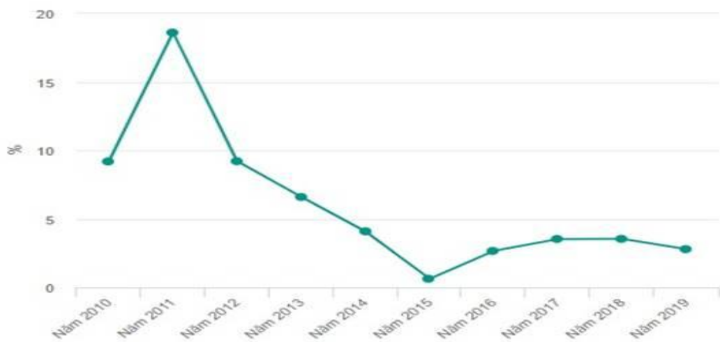
Lạm phát Việt Nam, giai đoạn 2010-2019

Trong bối cảnh nền kinh tế tăng trưởng mạnh mẽ, lạm phát năm 2019 chỉ đạt 2,73%. Như vậy lạm phát năm 2019 thấp nhất trong 3 năm gần đây khi năm 2018 là 3,54% và năm 2017 là 3,53%. Lạm phát duy trì ở mức thấp tiếp tục tạo cơ hội cho Ngân hàng Nhà nước thực hiện các chính sách nới lỏng tiền tệ linh hoạt và hiệu quả hơn.