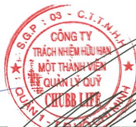
Lâm Hải Tuấn Chủ tịch Công ty