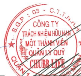
Lâm Hải Tuấn Chủ tịch Công ty Ngày 27 tháng 3 năm 2017

Các thuyết minh từ trang 10 đến trang 24 là một phần cấu thành các báo cáo tài chính này.